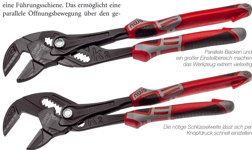
Parallele Backen und ein großer Einstellbereich machen das Werkzeug extrem vielseitig

Ausstattung Wie bei allen Zangenschlüsseln, erinnert auch bei NWS die Optik zuerst einmal an eine Wasserpumpenzange. Das ist nicht verwunderlich, weil die Wapu-Zange Ausgangsbasis dieses Werkzeugs ist. Nur ist der bewegliche Teil des Zangenmauls nicht direkt mit dem Griff verbunden, sondern über eine Hebelmechanik und eine Führungsschiene. Das ermöglicht eine parallele Öffnungsbewegung über den ge-