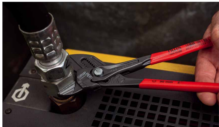
Auch bei Überwurfmutter an Rohrflanschen findet der Gripper oft Verwendung