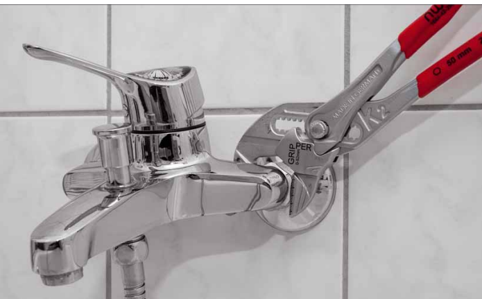
Im Sanitärbereich wird das Werkzeug wohl am häufigsten verwendet

den Namen „Gripper“ getaufte Version von NWS erreicht, die wir hier gerne vorstellen möchten.