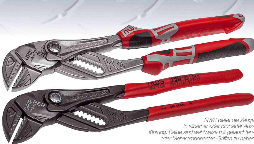
NWS bietet die Zange in silberner oder brüniertes Ausführung. Beide sind wahlweise mit getauchten- oder Mehrkomponenten-Griffen zu haben

samen Arbeitsbereich des Werkzeugs. Im Gegensatz zur Wapu-Zange hat der Zangenschlüssel auch keine verzahnten und gewölbten Greifflächen, sondern zwei glatte Flächen. Über ein Zahnsegment in Verbindung mit einer Schnellöseeinrichtung kann der Schlüssel mit einer Hand auf die benötigte Schlüsselweite eingestellt werden. Die reicht beim Testgerät von 0 – 52 mm. Das Werkzeug hat eine Länge von 260 mm und wiegt ca. 410 g.